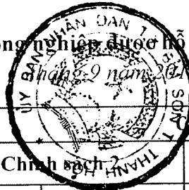
Biểu 5.2: Các chính sách của Hợp tác xã nông nghiệp được hỗ trợ giai đoạn 2015-2018 (Kèm theo Công văn số /UBND-KT ngày tháng năm 2018 của UBND thị xã Bim Sơn)