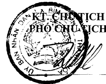
Mai Đình Lâm

- Dự toán kinh phí sử dụng cho ĐT, BD cán bộ, công chức giai đoạn 2019-2021: 1.136.600.000đ Trong đó, năm 2019: 397.800.000đ; năm 2020: 369.400.000; năm 2021: 369.400.000đ.